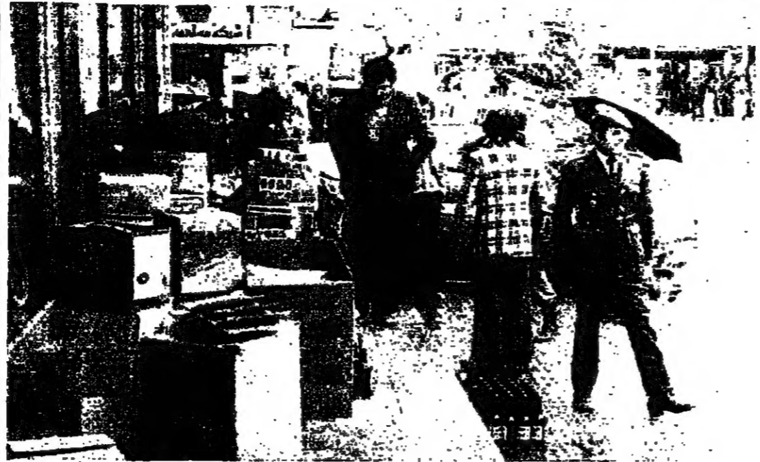
اصحاب البسطة يلبسون بملابسهم